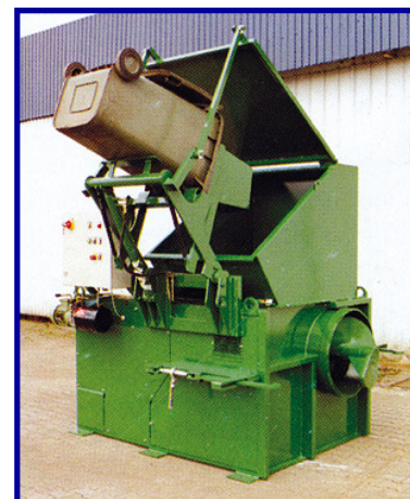
HSP mit Hub-Kippvorrichtung