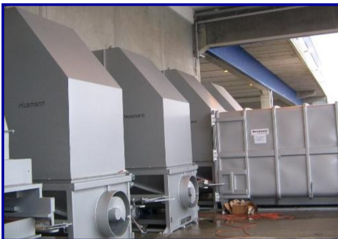
HSP mit Wandanschlußtrichter